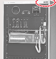
WL-5090 / 5590 シリーズ