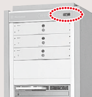
WL-6000 / 6500 シリーズ