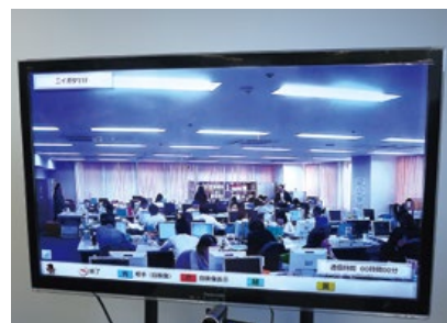
新潟BPOセンターの様子