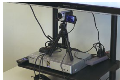
本社は固定カメラ、新潟はPTZカメラで角度を変えて室内を撮影