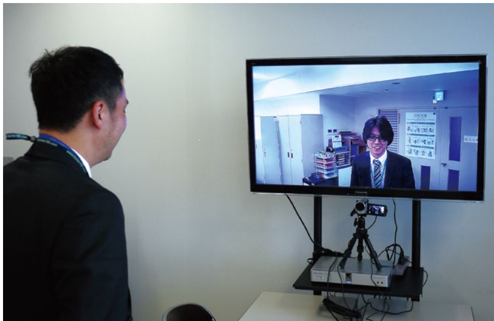
日常的なコミュニケーションにより親密度も増し、業務連携もスムーズ