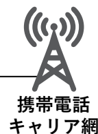
携帯電話 キャリア網