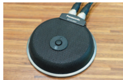
集音性の高いHDコム専用マイク