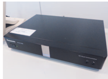
本社に設置されたHDコム