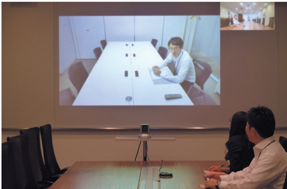
本社会議室から日本全国の事務所や店舗とのコミュニケーションが可能