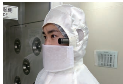
ウェアラブルカメラを装着したクリーンルームの作業員