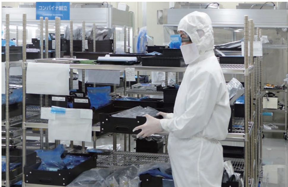
2階の製造事務所と1階のクリーンルームで円滑にコミュニケーション