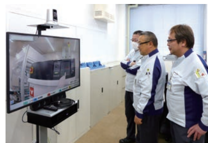
機器に表示された文字や数値まで鮮明に確認可能