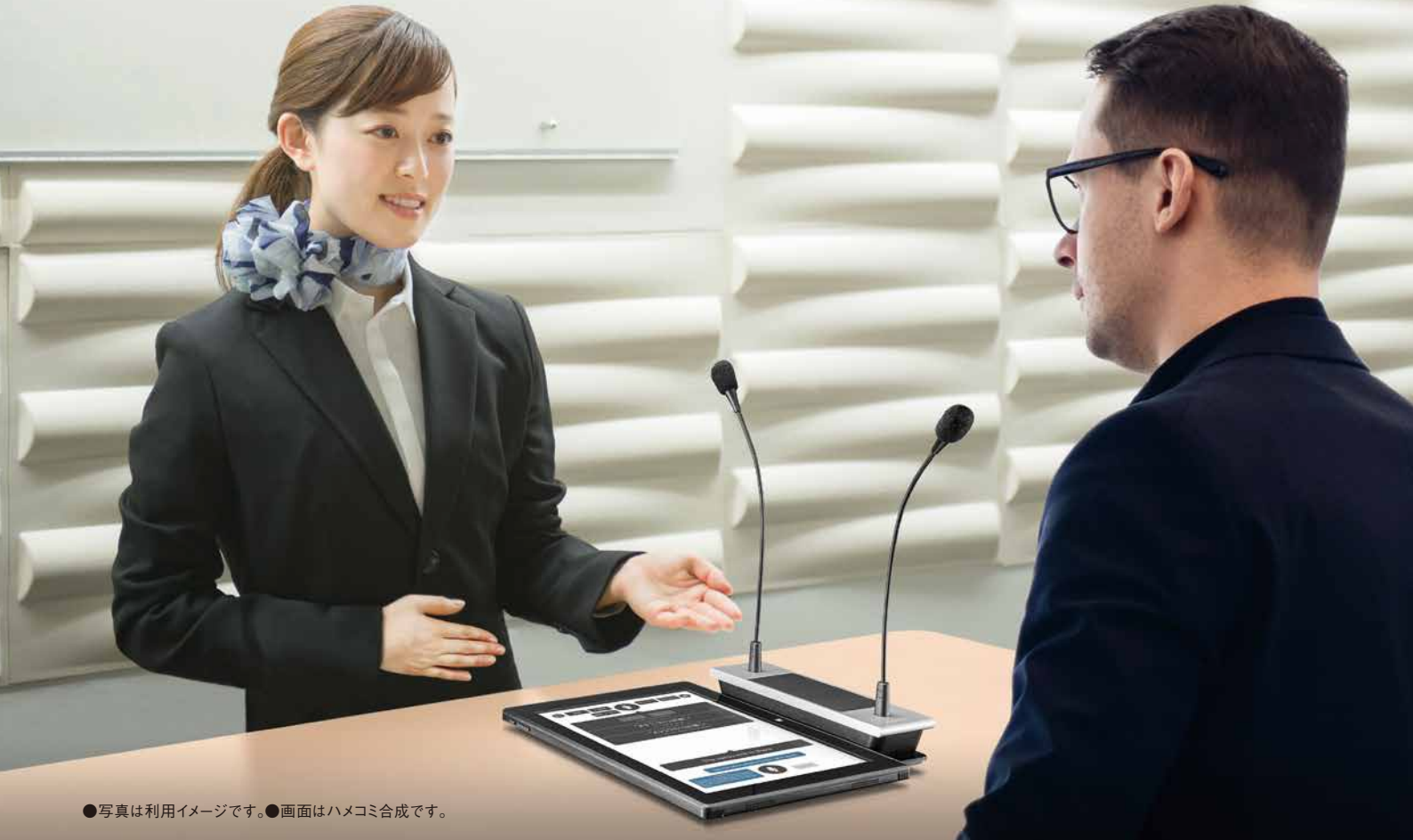
●写真は利用イメージです。●画面はハメコミ合成です。